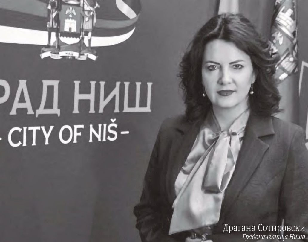
Драгана Сотировски Градоначелница Ниша